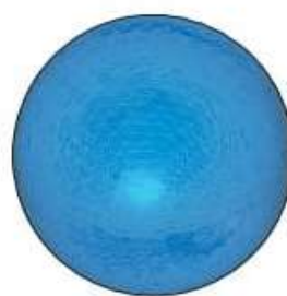
1 шт. 4100758 Шар, 52 мм, синий